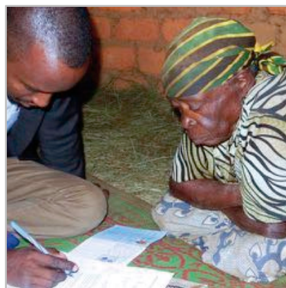
Das grosse Vertrauen der alten Menschen in Kwa Wazee erleichtert es, in umfangreichen Umfragen ihre Lebensbedingungen besser kennenzulernen und von ihnen zu lernen.