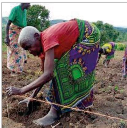
Die Rente unterstützt die Selbsthilfe. Viele der Frauen und Männer schliessen sich zu Nachbarschaftsgruppen zusammen, zum Sparen, zur Nothilfe, zum Beackern von Land.