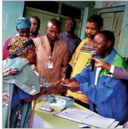
Historischer Moment im Distrikt Muleba. Am 15. November 2016 erhält – im Rahmen des Kwa Wazee Pilotprogramms – die erste Frau Tansanias eine bedingungslose Grundrente, übergeben vom Distriktkommissär.