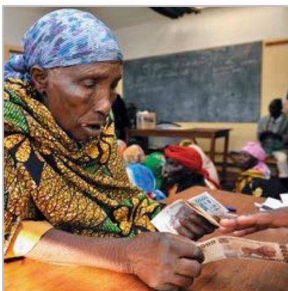
Bereits eine Rente von umgerechnet 6€ pro Monat lindert Not und Stress, gibt Sicherheit und Selbstvertrauen und stärkt die Stellung alter Menschen in Familie und Gemeinschaft.

Kwa Wazee war die erste Organisation in Ostafrika, die bedingungslose Renten für alte Menschen einführte. Die Barzahlungen erwiesen sich als das Instrument für Grundsicherung und Entwicklung, und sie bleiben wichtigster Pfeiler von Kwa Wazee. Daneben werden neue Ansätze erprobt, welche Selbsthilfe, Selbstbewusstsein und Selbstorganisation alter Menschen stärken: Alte lehren sich gegenseitig Gesundheitsvorsorge, sie üben Selbstverteidigungstechniken, sie bauen gemeinsam Äcker an, sie wählen ihre Komitees und ihre Altenräte.