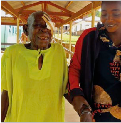
In 70 Gruppen üben sich über 1000 Frauen und Männer jeden Monat in Gesundheitsprävention. Dank der mobilen Augenklinik können hunderte von ihnen wieder besser sehen und ihr Leben selbständiger gestalten.